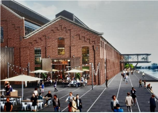
Van Gendthallen toekomst