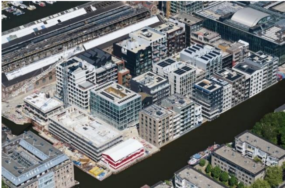
De SOO-kavel, mei 2022

Ruim 4 jaar werken wij nu samen met andere (buurt)organisaties aan Over de Brug en BOB Helpt. We doen dit met het doel dat nieuwe bewoners zich thuis voelen en bewoners van de omliggende buurten zich welkom voelen in de nieuwe wijk. De kansen die de nieuwe wijk biedt willen we ten goede laten komen aan de h le buurt.