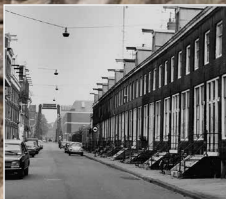
Hoogte Kadijk in 1976.

“In de laatste bewonersbrief die we kregen, stond dat bewoners niet meer per brief geïnformeerd worden als de weg tijdelijk wordt afgesloten of de rijrichting verandert. Dat kan dus leiden tot praktische problemen. Ik had laatst burens die net in zo’n periode van drie hoog moesten verhuizen. Ga dat dan maar ‘ns organiseren!’”